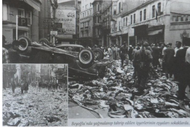
6-7 Eylül'de Beyoğlu'nda yağma edilen işyerleri

(Kaynak: Cumhuriyet Ansiklopedisi-1941-1960-YKY Yayınları İstanbul, 2003)