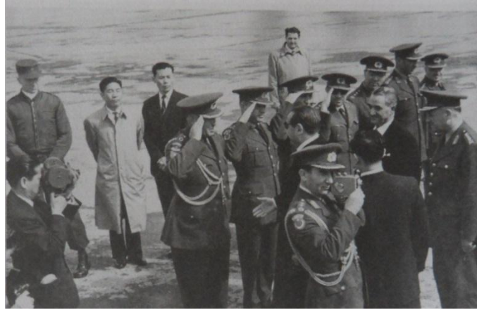
Adnan Menderes Kore Tugayı subaylarını kutlarken